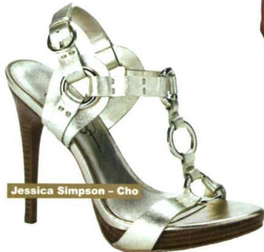
Jessica Simpson - Cho