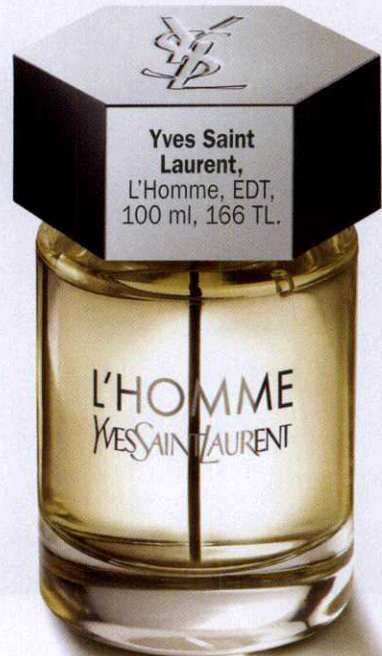
Yves Saint Laurent, L'Homme, EDT, 100 ml, 166 TL.