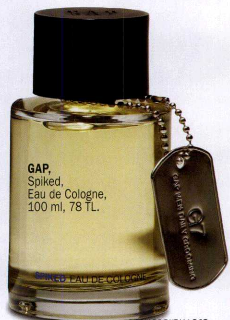
GAP, Spiked, Eau de Cologne, 100 ml, 78 TL.