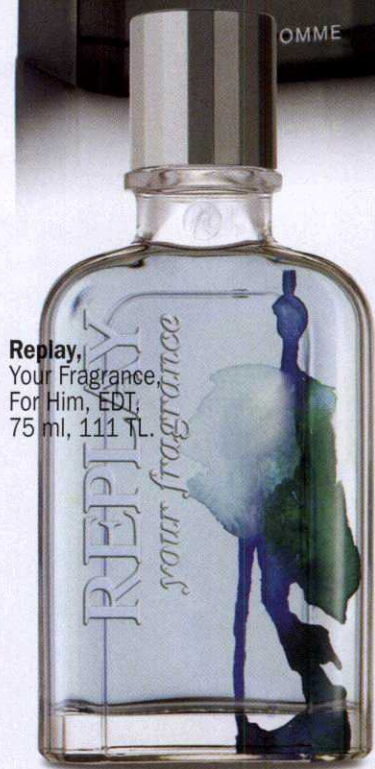
Replay, Your Fragrance For Him, EDT, 75 ml, 111 TL.