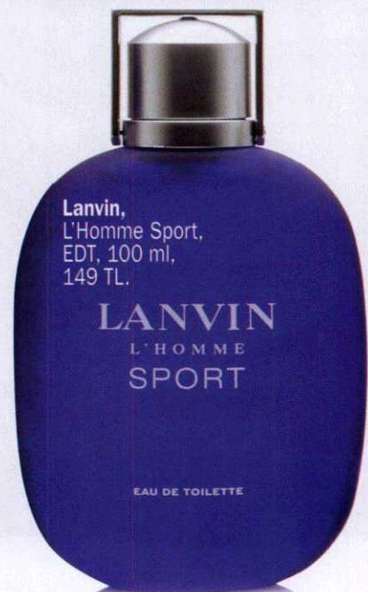
Lanvin, L'Homme Sport, EDT, 100 ml, 149 TL.