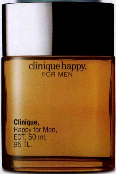
Clinique, Happy for Men, EDT, 50 ml, 95 TL.