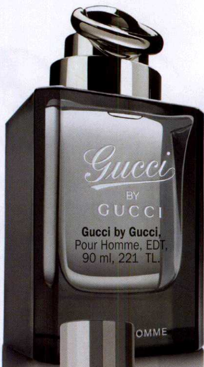
Gucci BY GUCCI Gucci by Gucci, Pour Homme, EDT, 90 ml, 221 TL.