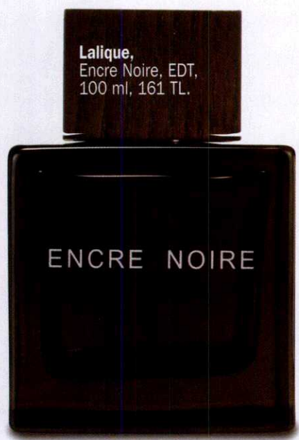
Lalique, Encre Noire, EDT, 100 ml, 161 TL.