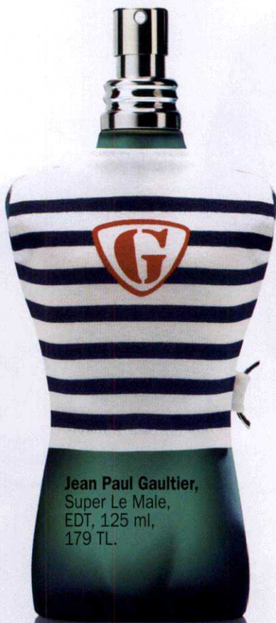
Jean Paul Gaultier, Super Le Male, EDT, 125 ml, 179 TL.